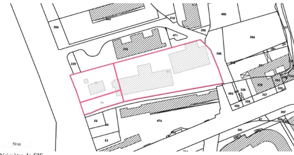
Périmètre du SIS Parcelles cadastrales - IGN